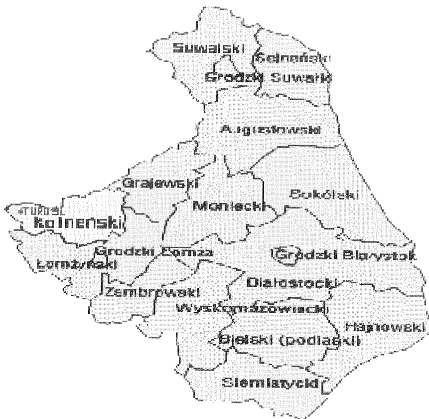
Mapa województwa podlaskiego.

Nowa Ruda jest jedną z 21 miejscowości gminy Turośl położoną w obszarze Kurpiowskiej Puszczy Zielonej. Gmina Turośl położona jest w zachodniej części województwa podlaskiego w powiecie kolneńskim.