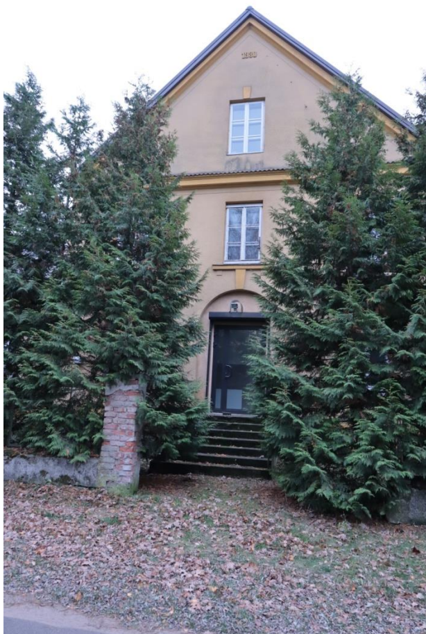
IX-XI 2021r.