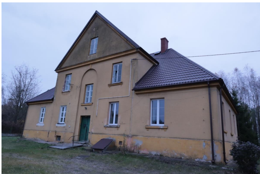
IX-XI 2021r.