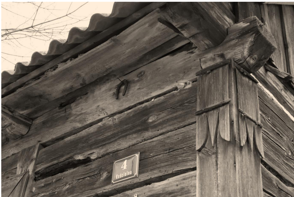
IX-XI 2021r.