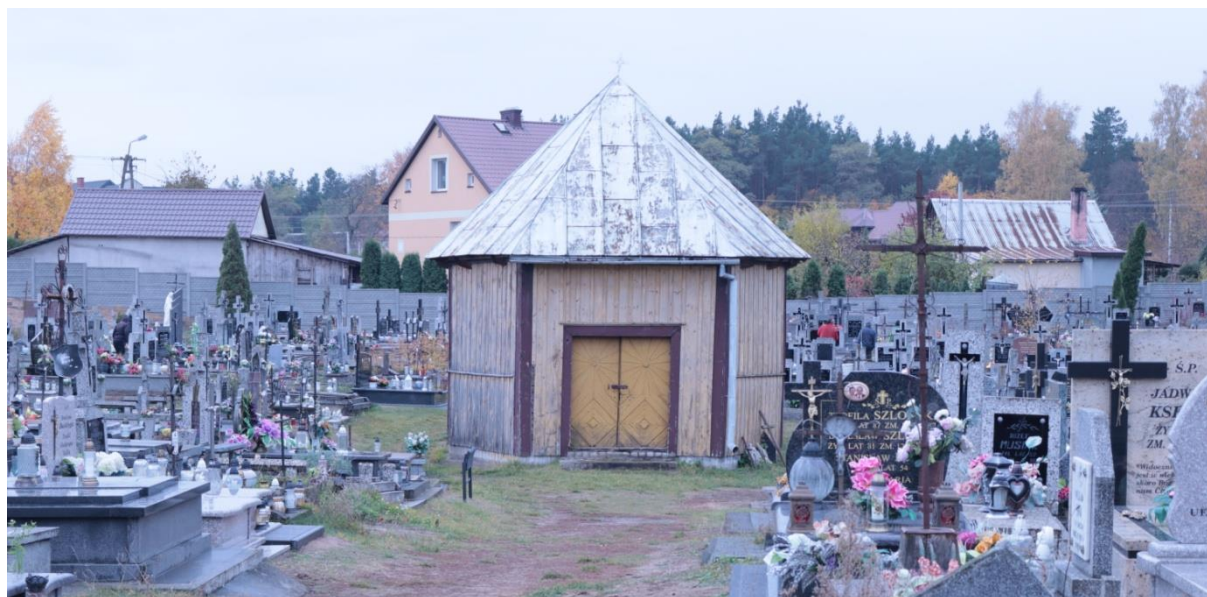
IX-XI 2021r.