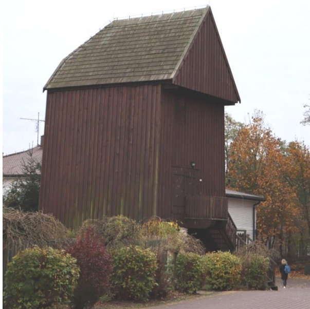
Fot. 9 Wiatrak koźlak w Turośli

Na terenie gminy spośród zabytków techniki można wymienić wiatrak typu koźlak, w którym mieści się Izba Regionalna znajdujący się obok spichrza będącego siedzibą GOK. Został on wpisany do wojewódzkiej ewidencji zabytków nieruchomych. Pierwotnie powstał prawdopodobnie w okolicy Brańska, następnie przed II wojną światową przeniesiono go do wsi Radziszewo-Króle a w 1983 r. do Turośli. W 2013 r. został gruntownie wyremontowany. Obiekt jest w dobrym stanie, natomiast obecnie ma zdemontowane skrzydła.