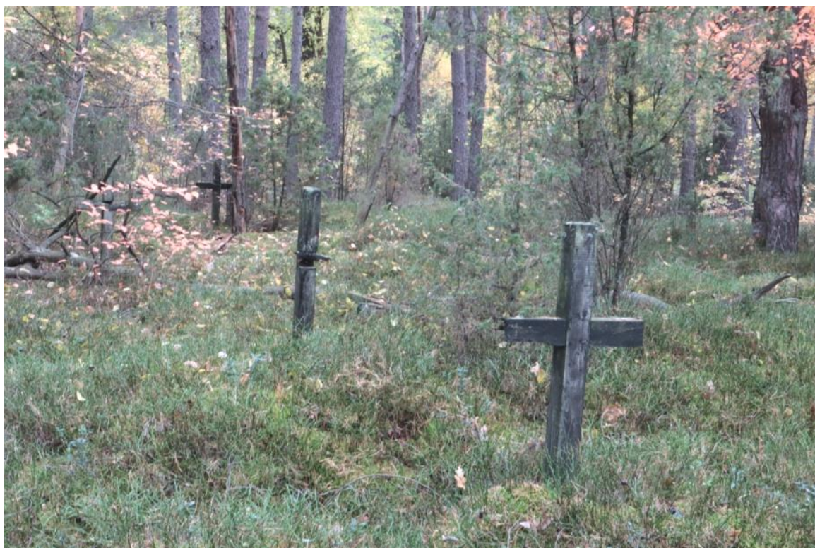
Fot. A. Brzostowska, IX-XI 2021r.