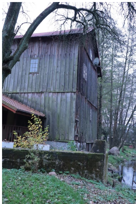
Fot. 10 Młyn wodny w Popiołkach