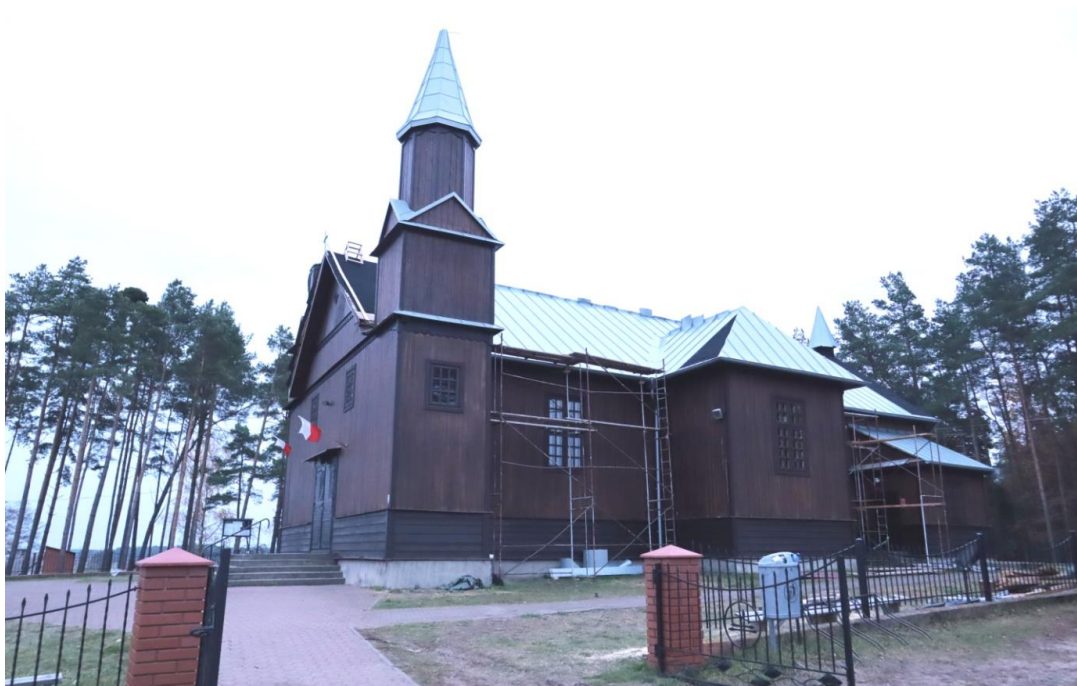
IX-XI 2021r.