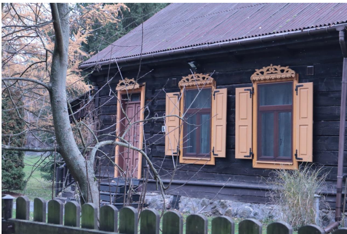
IX-XI 2021r.