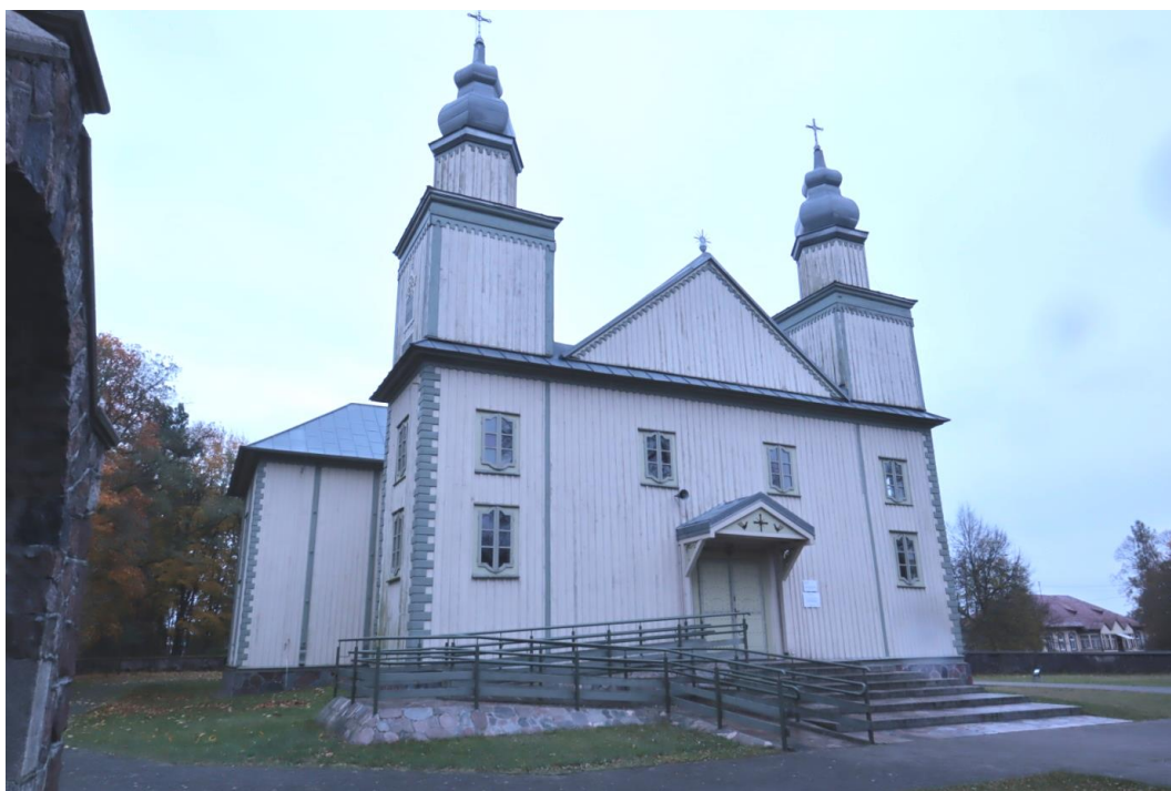
IX-XI 2021r.