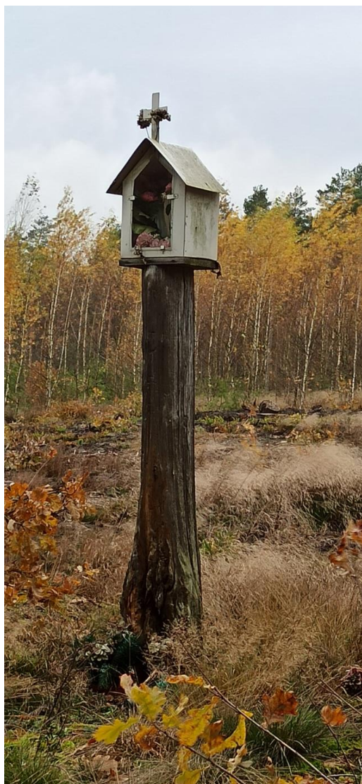
IX-XI 2021r.